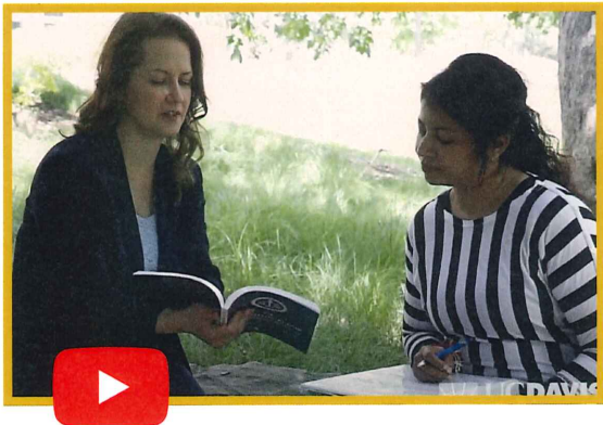
Visit our Youtube page to learn more stories about King Hall, our faculty and our students: youtube.com/UCDavisLaw